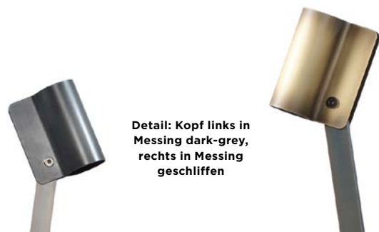
Detail: Kopf links in Messing dark-grey, rechts in Messing geschliffen