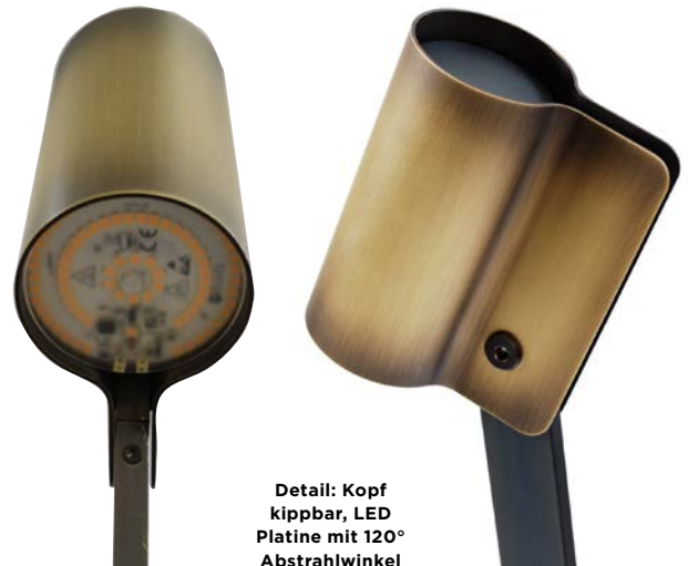
Detail: Kopf kippbar, LED Platine mit 120° Abstrahlwinkel